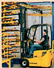
Value gibt es meist in der Old Economy

Dass Value richtig Spaß und Gewinne bringen kann, zeigen die zehn Empfehlungen in EURO vom August 2003. Den Top-Performer Euwax wollte vor einem Jahr noch kaum ein Anleger haben. Und das trotz eines KGV von 6,9, einer Dividendenrendite von 5,4 Prozent und einer phantastischen Eigenkapitalquote von knapp 90 Prozent. Seither sind aber viele Anleger auf diesen Value-Zug